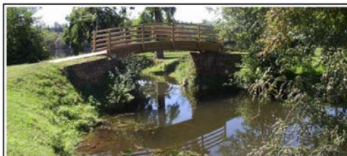
La base nautique de Trémolat

La base nautique de Trémolat située non loin du Bugue a axé ses activités de pleine nature principalement sur les sports nautiques : canoë, ski nautique, voile. Un choix qui permet aussi bien de se perfectionner que de découvrir