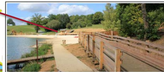
La base nautique de Rouffiac

La base de loisir départementale de Rouffiac est située dans le Nord Est de la Dordogne sur la commune d'Angosse à proximité de Lanouaille.