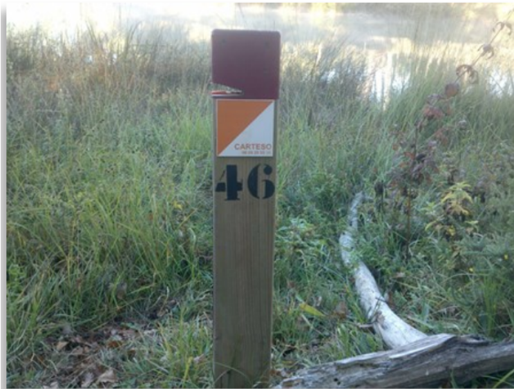
l'entrée du site.

Ensuite, ce qui les frappe, c'est la qualité et l'importance de l'aspect environnemental : un jour on se baigne, un autre jour on se promène à pied ou à vélo en forêt, on peut aller aussi jusqu'à la ferme du Parcot. Le Conseil général a réussi ici, ce dont beaucoup de gens doutaient, la cohabitation d'un vrai site touristique géré, entretenu, accueillant, qui vit toute l'année et d'une zone naturelle préservée. Cela fait maintenant l'unanimité. Avant, on peut le dire, La Double était un peu oubliée... Le travail réalisé au Parcot, avec l'association qui anime le lieu, et autour des étangs de La Jemaye, ont fait de nouveau parler de La Double et en ont fait percevoir les qualités naturelles et l'importance. Seul le Conseil général pouvait faire ça.