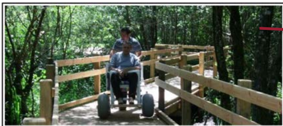
Le Grand étang de Saint Estèphe

Avec son label handiplage, l'étang de Saint Estèphe fraîchement rénové est désormais accessible à tous, il est situé à l'extrême nord du département au cœur de denses forêts du Périgord Vert qui offrent de vastes chemins de randonnées.